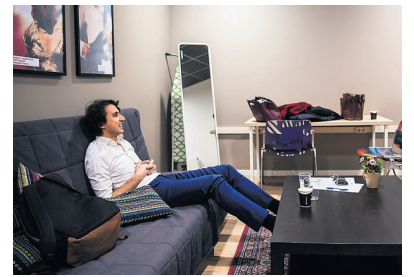
21.26: Klaver mag een paar minuten op de bank zitten en moet daarna de pers en fans te woord staan.

ook een legertje 'beeldvoerders', dat moet zorgen dat Klaver gunstig overkomt op camera en in internet-filmpjes. Bij de laatste sessie in TivoliVredenburg zijn er niet minder dan 25 tot 30 nerds mee bezig. Beeld tell, beseffen ze bij GroenLinks. Ter illustratie: er is overwogen T-shirts te laten drukken met op de achterkant de data van de meetups, als was het een tour van een rockband. Het team is toch al niet vies van een staaltje Amerikaans campagnevoeren. Zo koos Klaver – geheel naar voorbeeld van Obama – voor een 'grassrootsstrategie', wat zoveel wil