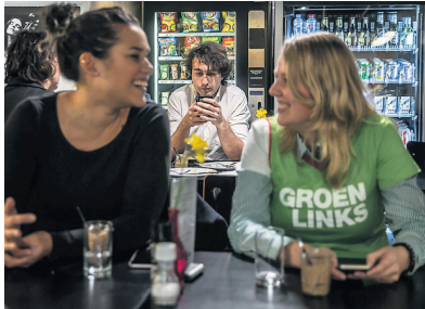
18.14 uur: klaar met eten.