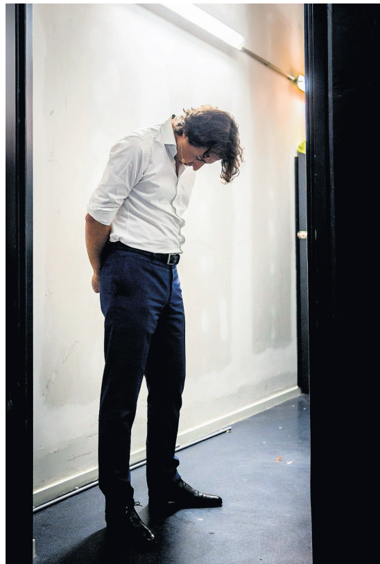
20.05: Klaver concentreert zich minuten voordat hij het podium op moet.