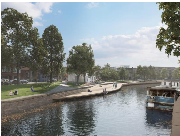
Afbeelding 5: Dudok aan het Diep. Ontwerp Marseille Buiten en IRIS Architecten.

Een andere locatie die uitnodigt tot zwemmen is