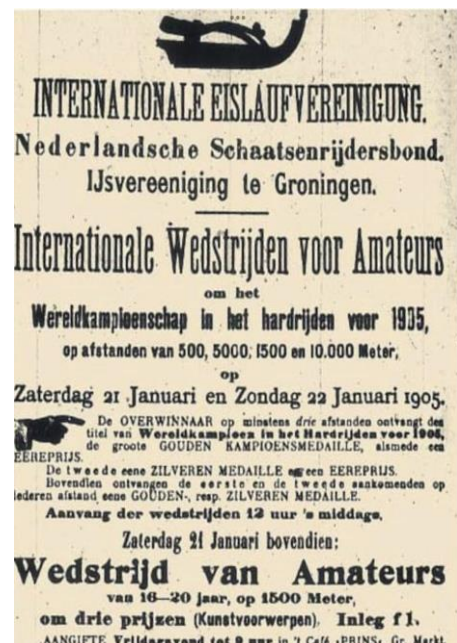
Afbeelding 3: Affiche van Wereldkampioenschap schaatsen allround 1905.

Essentieel voor het tot stand laten komen van natuurijis op de Drafbaan is de ingenieuze nevel- of sproeitechnologie. Gedacht moet worden aan een systeem dat volledig gemechaniseerd en geautomatiseerd is. Uit contact met de Winterswijkse IJsvereniging (waar al een soortgelijk systeem is ontwikkeld) is gebleken dat isolatie onder de asfaltlaag (schuimbeton) en opstaande randjes aan de zijkant niet nodig zijn, mits je de ijsvloer zich in hele dunne lagen laat opbouwen (opsproeien). Daardoor leent deze techniek zich ook voor de drafbaan. Dat er geen opstaande randjes nodig zijn maakt de techniek geschikt voor de drafbaan, die in de zomer immers ook gebruikt moet kunnen worden als evenementenlocatie. De software om een geavanceerd sproeisysteem aan te sturen (draadloos) is er al wel, de hardware echter nog niet. Wel goed om te realiseren: er wordt in het geval van de Drafbaan nieuwe technologie ontwikkeld. Daar kleven ook risico's aan er zal een experimentele fase nodig zijn om kinderziektes te overkomen. Durf en ambitie zijn nodig. De Drafbaan is 1100 meter lang en 16 meter breed, wat bijna drie keer langer is dan de standaard buiten ijsbanen van 400 meter en ruim anderhalf keer zo breed. Een standaard buitenijsbaan omvat grofweg 4.000 m 2 . Bij de Drafbaan zal het gaan om grofweg 17.600 m 2 .