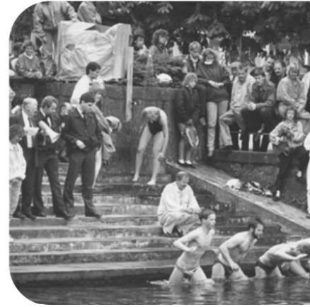
Afbeelding 4: Zwemwedstrijd in het Stadspark.

Een mogelijke toekomstige (en historische) zwemlocatie is de vijver in het Stadspark. In deze vijver werd vroeger ook gezwommen, er werden zelfs zwemlessen gegeven! Zoals al aangegeven in de Visie Stadspark Park voor de Stad wordt de waterkwaliteit al gemonitord en wordt al gehint naar een toekomstige zwemlocatie. Wij willen dat het proces om hier een zwemlocatie van te maken zo snel mogelijk officieel gestart wordt en dat er gekeken wordt of vooruitlopend op de officiële aanwijzing (dat duurt immers een tijdje) al een pilot gemaakt kan worden. Zo is het ook begonnen met het Stadsstrand.